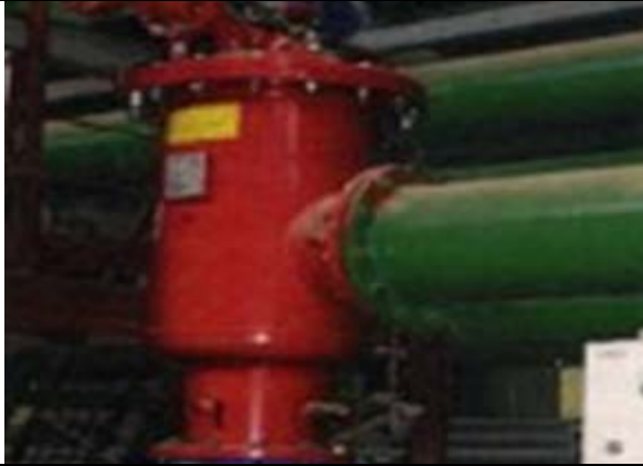
Промышленное предприятие 5 фильтров ABF 10000, 800 микрон (оборотный цикл охлаждения) Выполнено: Amiad Water Systems