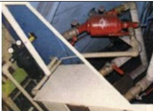
Фильтр 2''T Super Scanaway Plastic (слева) Фильтр 2'' Super Scanaway Steel(справа) Рейтинг фильтрации : 80 микро Производительность : 16 м3/ч Выполнено: Amiad Water Systems