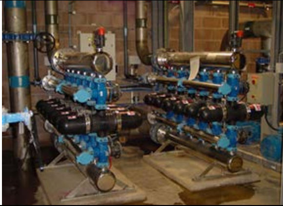
Очистка питьевой воды Производительность: 200 м3/ч Фильтр: System 2 x6 x3” Spin Klin systems Выполнено: Amiad Water Systems