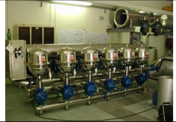
Предфильтрация перед системой UF Выполнено: Amiad Water Systems