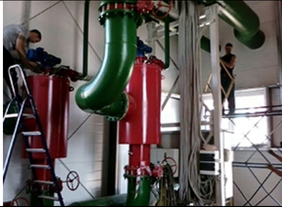
Промышленное предприятие г. Тольятти Выполнено: Amiad Water Systems