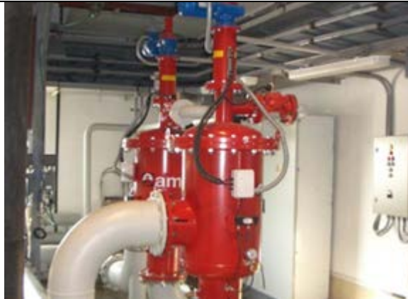
ГРЭС 270 м3/ч, 200 микрон Выполнено: Amiad Water Systems