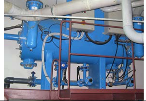
Гостиничный комплекс г. Екатеринбург Выполнено: Amiad Water Systems