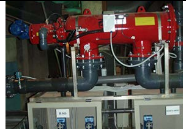
ТЭЦ 400 м3/ч, 200 микрон Выполнено: Amiad Water Systems