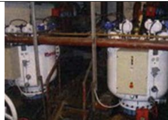
Металлургический комбинат Охлаждение доменной печи морской водой Фильтр: 24'' MegaBRUSH гуммированные Рейтинг фильтрации : 2,500 микрон Выполнено: Amiad Water Systems