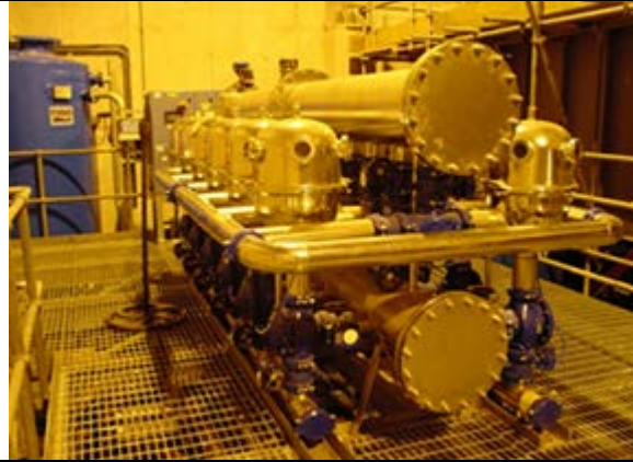
Очистка питьевой воды Производительность: 2840 м3/ч Фильтр: System 12 x4” Spin Klin Galaxy systems Выполнено: Amiad Water Systems