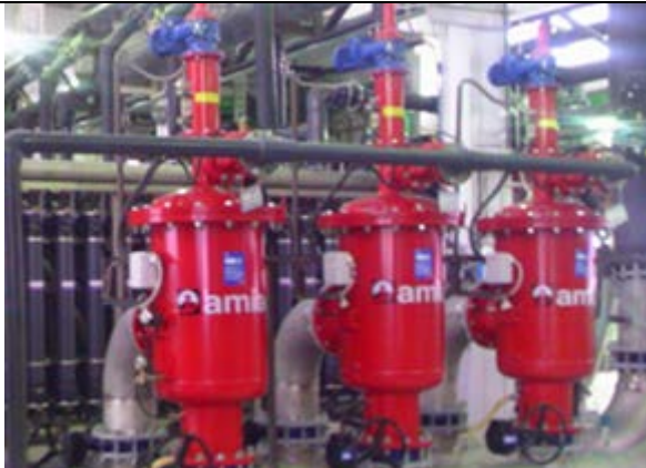
ТЭЦ 600 м3/ч, 200 микрон Выполнено: Amiad Water Systems