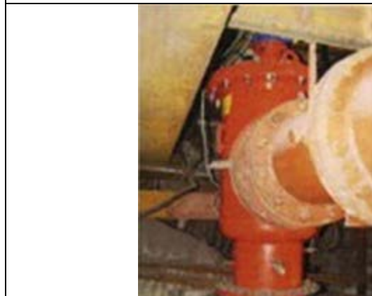
Оборотный цикл системы водоснабжения аглофабрики Фильтр: 14'' ABF10,000 Рейтинг фильтрации: 800 микрон Производительность: 650 м3/ч Выполнено: Amiad Water Systems