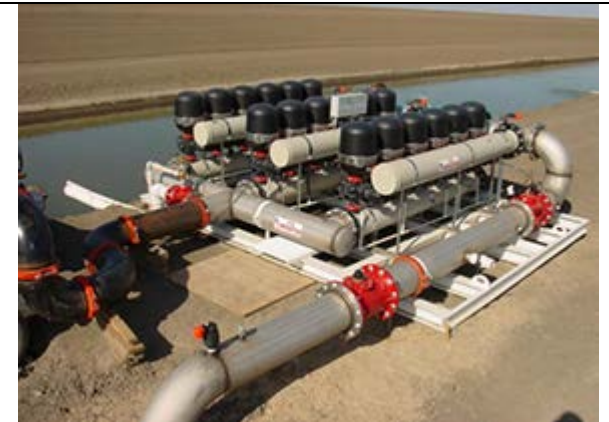
Очистка воды из поверхностного источника Производительность: 865 м3/ч Фильтры: 3 Galaxy 18-unit systems Выполнено: Amiad Water Systems