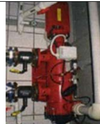
Предварительная очистка воды Фильтр 3''SAF – 1,500 SLN Рейтинг фильтрации : 25 микрон Производительность : 50 м3/ч Выполнено: Amiad Water Systems