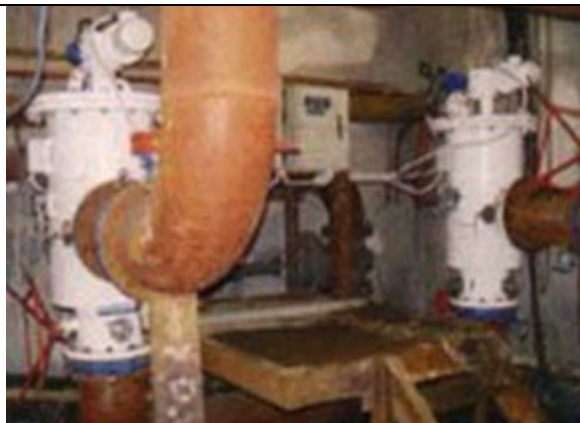
Металлургический комбинат Охлаждение форм доменной печи морской водой Фильтр: 12'' ABF 10,000 гуммированные Производительность : 1,100 м3/ч Выполнено: Amiad Water Systems