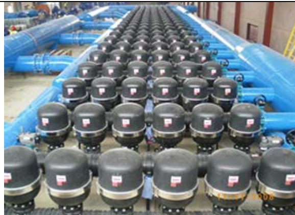
Очистка воды для питьевых нужд Фильтры: 6” Spin Klin module system Производительность: 23000 м3/ч Выполнено: Amiad Water Systems