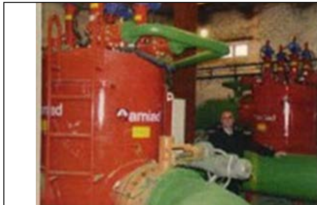
Металлургический комбинат Обратный цикл охлаждения доменной печи Фильтр: 24'' MegaEBS Рейтинг фильтрации: 800 микрон Производительность: 2,200 м3/ч Выполнено: Amiad Water Systems